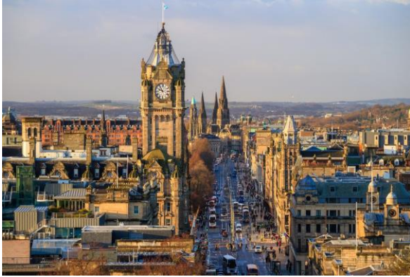
Edimburgo - Escócia