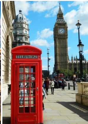
Símbolos de Londres