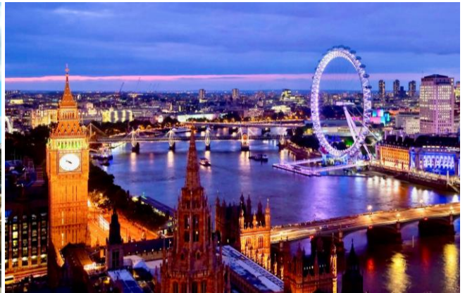
Londres - Inglaterra

Período: 14 de Agosto a 01 de Setembro de 2024 - 19 Dias Roteiro nº 240814BV01