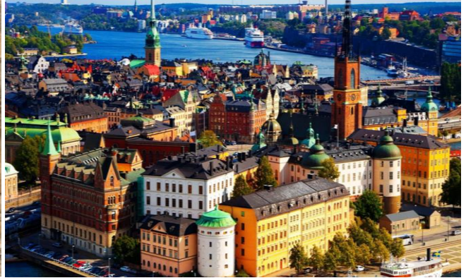
Dublin - Irlanda