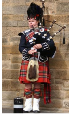
Gaita de Fole - Escócia